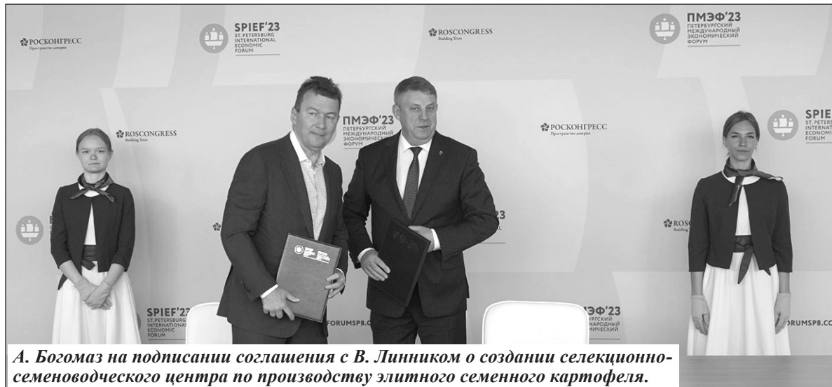
А. Богомаз на подписание соглашения с В. Путиным о создании селекционно-семеноводческого центра по производству элитного семенного картофеля.

Брянский губернатор пояснил, почему в прошлом году прирост производства сельского хозяйства превысил 10 процентов, а промышленности почти 18 процентов – второй показатель в России. Производство растет в том числе за счет равных условий, которые были созданы властями для всех предприятий. Что же касается крупных инвесторов, от которых прежде всего и зависит состояние областной экономики, то они на несколько лет – в зависимости от суммы вложений – освобождаются от налога на прибыль. Казну начинают пополнять уже тогда, когда производство работает. Впрочем, это не значит, что бюджет сегодня ничего не получает от инвесторов. Зна-