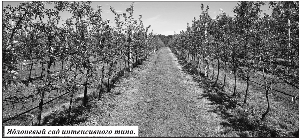
Яблоневый сад интенсивного типа.

щений для детей-сирот, в том числе 3 в г. Брянске на первичном рынке жилья и