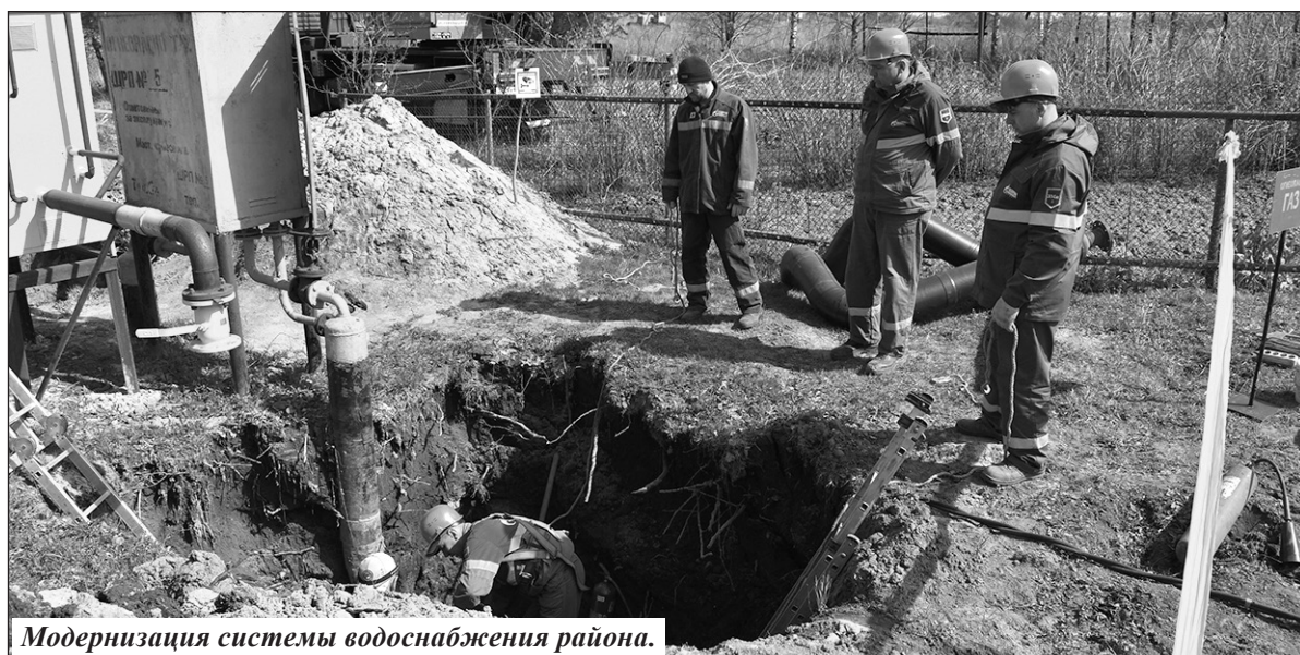
Модернизация системы водоснабжения района.

и местного бюджетов более 400 тысяч рублей, получено современное оборудование из департамента образования и науки на сумму 1,4 миллиона рублей.