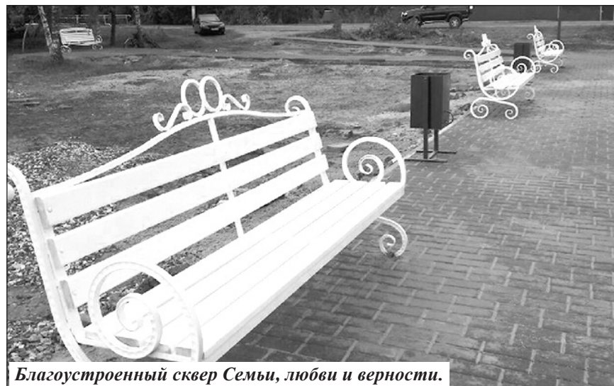
Благоустроенный сквер Семьи, любви и верности.