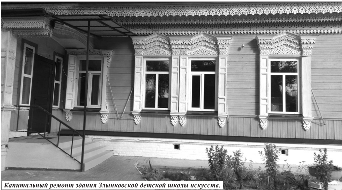
Капитальный ремонт здания Злынковской детской школы искусств.

Государственная программа «Обеспечение реализации государственных полномочий в области строительства, архитектуры и развития дорожного хозяйства Брянской области», мероприятие «Обеспечение сохранности автомобильных дорог местного значения и условий безопасного движения по ним». Благодаря этому проведены ремонт автомобильной дороги по ул. Щорса в г. Злынка, ремонт автомобильной дороги по ул. Большчева, ремонт объездной дороги по ул. К.Маркса и Вокзальной на сумму 9796,8 тыс. руб. Благодаря региональной программе «Развитие ТЭК и ЖКХ Брянской области» подпрограмма «Чистая вода», в районе проедена реконструкция артезианских скважин в с. Лысье, в д. Карпиловка, с. Денисковичи на сумму 23001,5 тыс. руб.