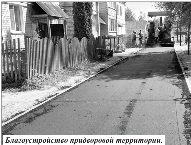
Благоустройство придворовой территории.

спортивного зала Мужинской школы (2,5 млн. руб.). В здании МБОУ СОШ № 1 п. Клетня Брянской области имени генерал-майора авиации Г.П. Политыкина отремонтированы туалеты, проведен текущий ремонт гидроизоляции фундамента.