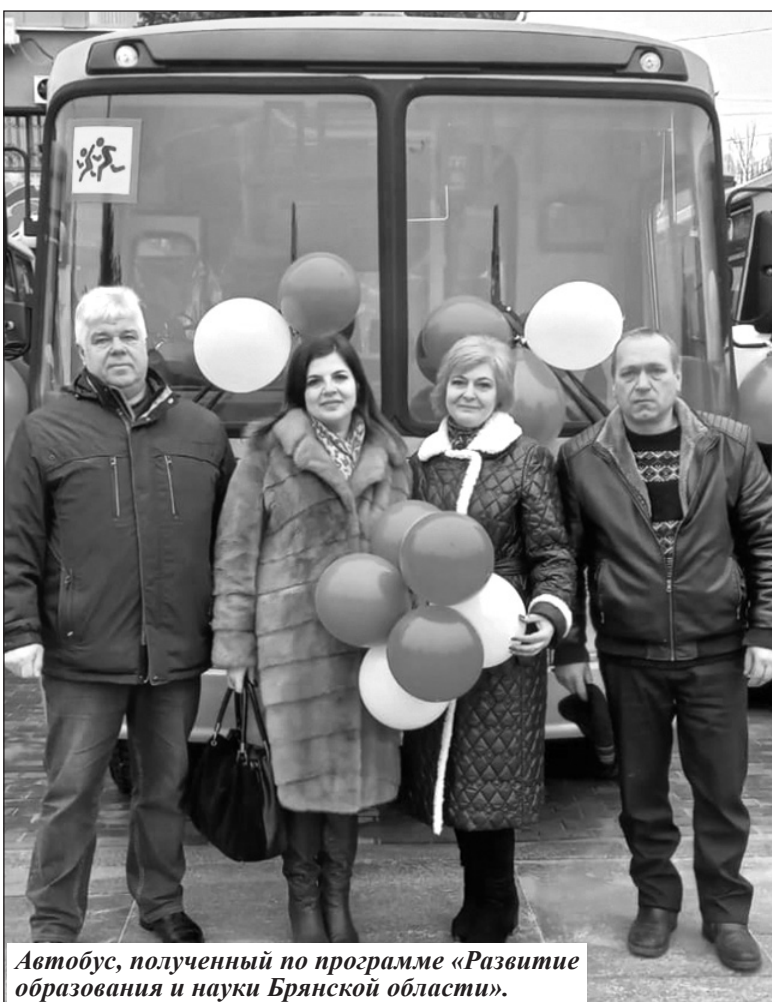
Автобус, полученный по программе «Развитие образования и науки Брянской области».