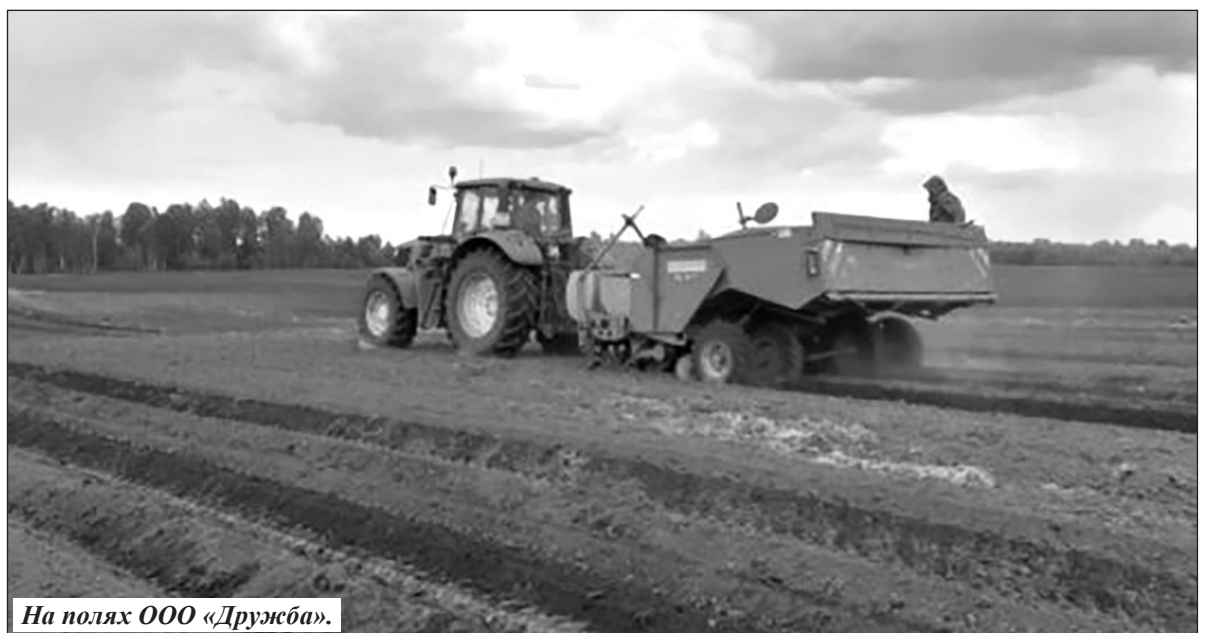
На полях ООО «Дружба».

Производство зерна в сельхозпредприятиях и крестьянских фермерских хозяйствах в 2022 году в бункерном весе составило 51 тысячу тонн при урожайности в среднем по району 66,5 ц/га. Выращиванием картофеля и овощей в районе занимается ООО «Дружба-2». В 2022 году в районе накопано 36 тысяч тонн картофеля при урожайности 373 ц/га. Валовой сбор овощей составил 4,4 тысячи тонн при урожайности 1339 ц/га. В рамках федерального проекта «Современная школа» с 1 сентября 2022 года начал работу третий в районе центр «Точка роста» в Воробейнской школе. На ремонт помещений под ее размещение направлено из областного