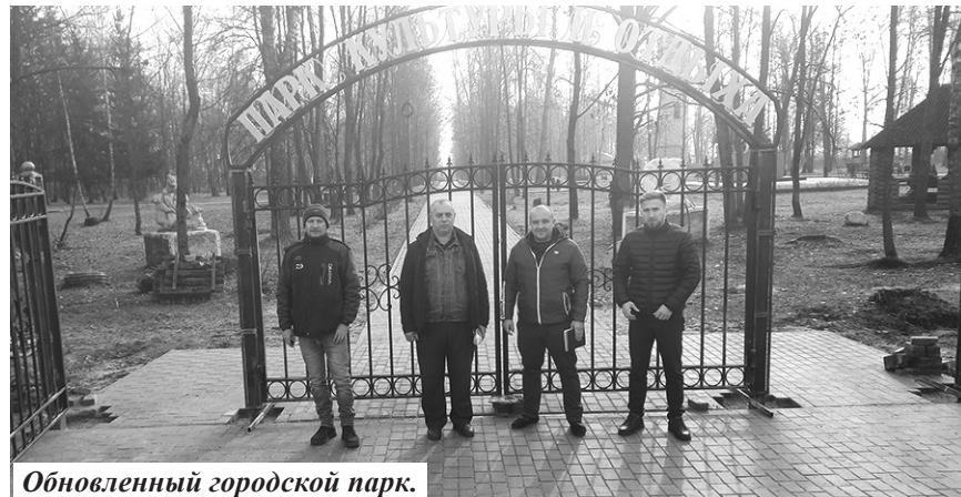
Обновленный городской парк.