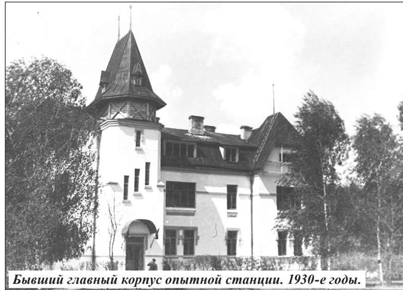
Бывший главный корпус опытной станции. 1930-е годы.

Одновременно с этими работами велось изучение условий местного сельского хозяйства, его техники и экономики по печатным материалам и путем личных посе-