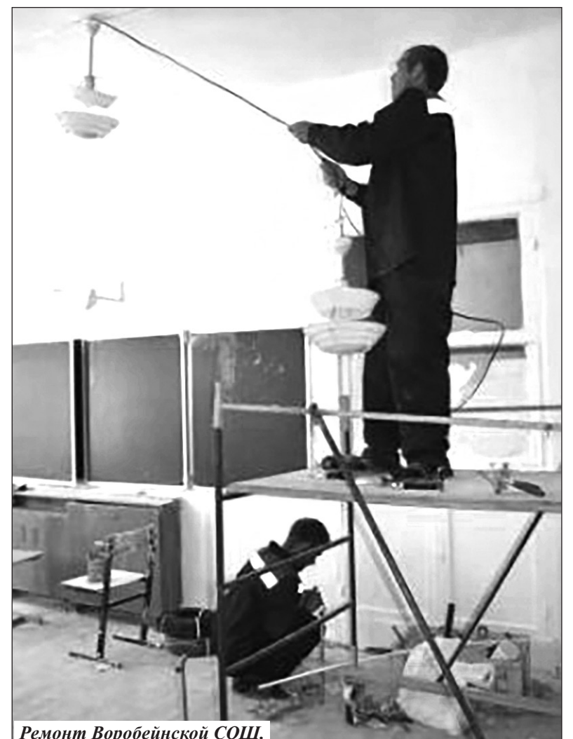
Ремонт Воробейнской СОШ.

Для подвоза учащихся Жирятинской школы к месту учебы и